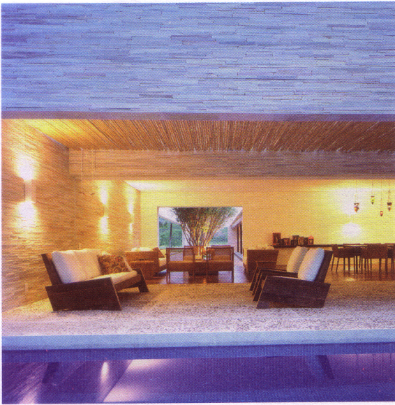
< VISTA DA SALA E PISCINA