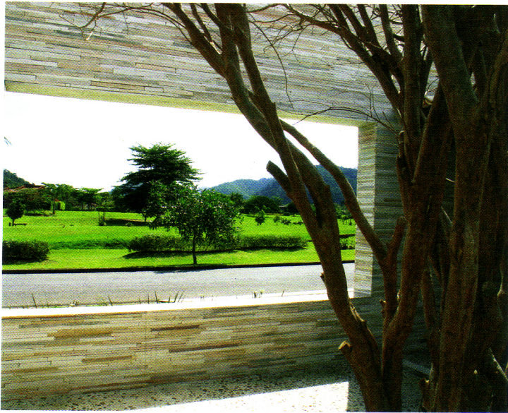
▲ VISTA DO ENTORNO A PARTIR DA ABERTURA DA FACHADA